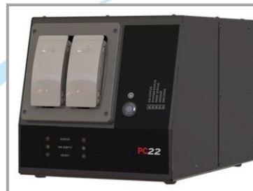
Ink-Station mit 2x 750ml Bulk-Tanks